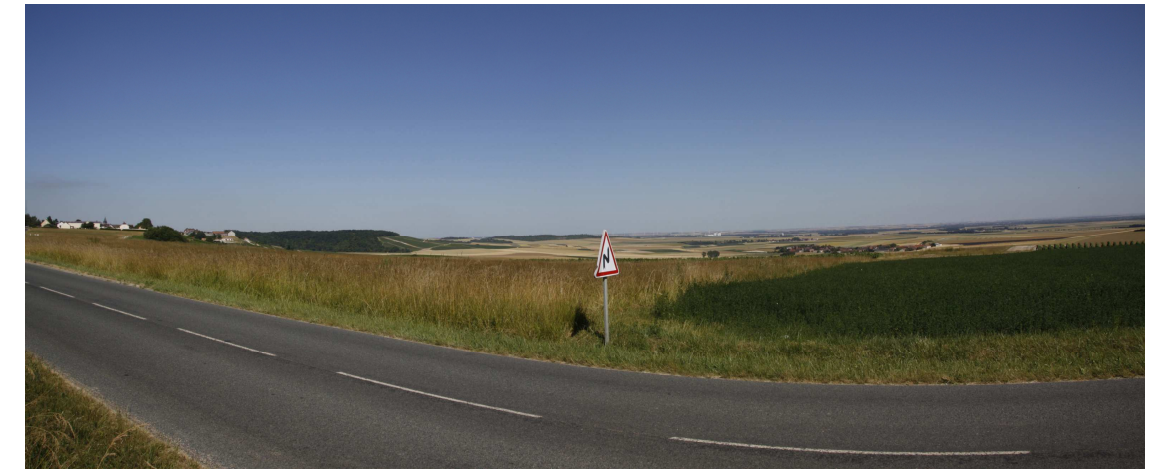
Le site actuel