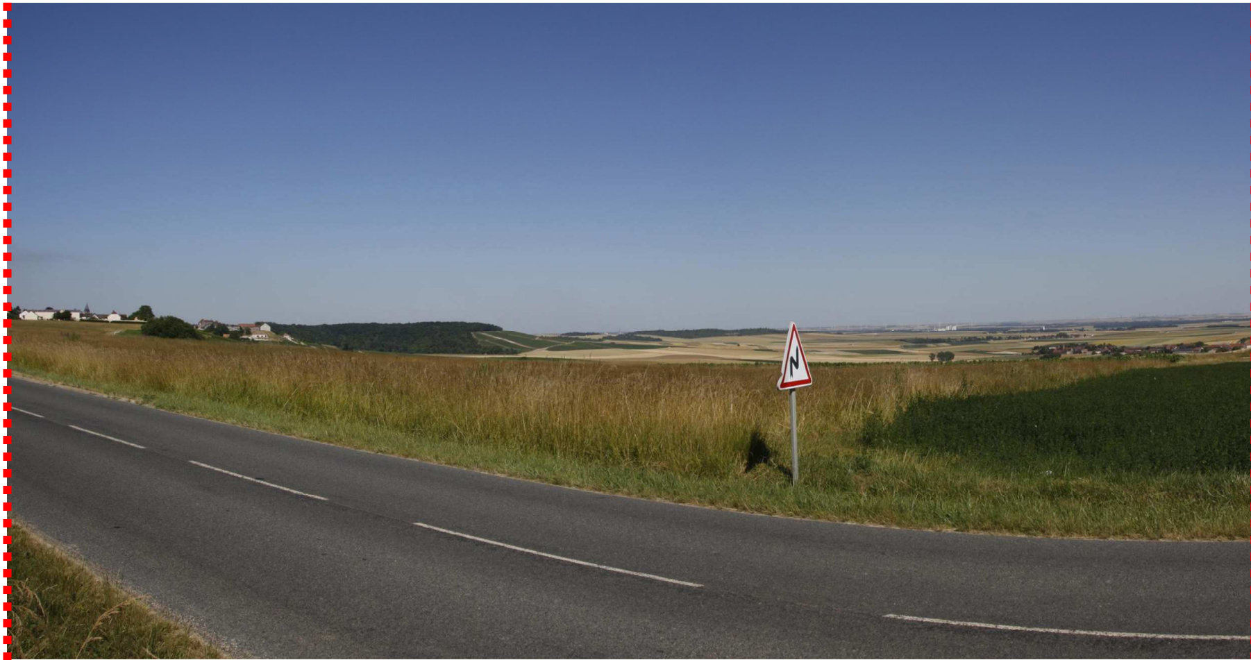
Photomontage recadré à 60°