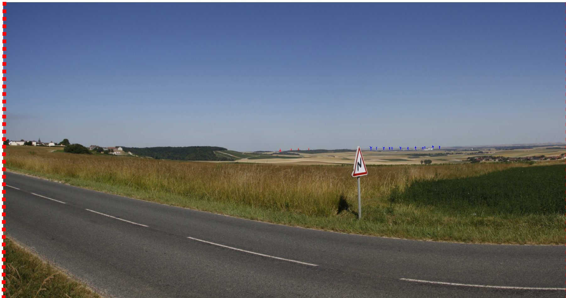
Photomontage d'interprétation recadré à 60°